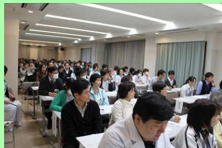
各演題の発表を聴く参加者のみなさん