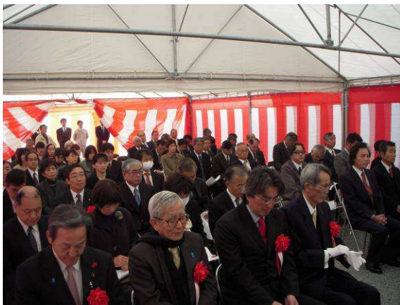
式典に参列のご来賓および関係者の皆さん