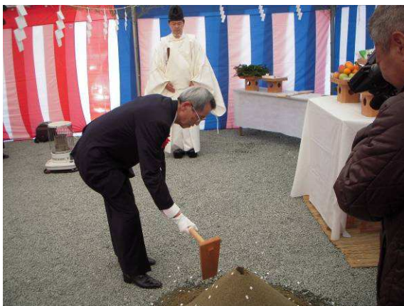
鍬入れを行う加戸理事長