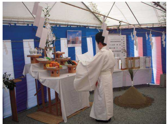
祝詞を上げる八幡神社武智宮司