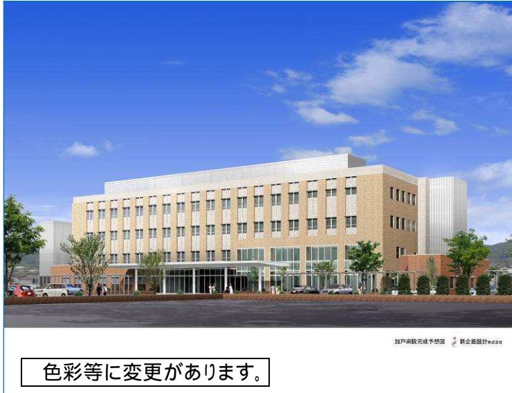
色彩等に変更があります。