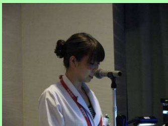
「当院でのNSTの取り組みについて」

医療の世界は日進月歩です。私たちの日頃の業務の中で疑問に思った事や、また患者さん、ご利用者の目線に立ち感じた事などが6題の研究の題材になりました。それらは一人ひとりを大切にしていきたいという想いが根底にあると感じられました。今後も日常の業務に満足することなく、疑問や課題を解決するように努力していかなければならないと思いました。