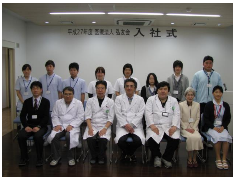
新入職員と役員等

平成27年4月1日より医療法人弘友会職員として、加戸病院と老人保健施設フレンドに分かれて勤務することになりました。新人研修で教わった弘友会の5つの理念を忘れず、精一杯頑張りたいと思います。どうぞよろしくお願いいたします。