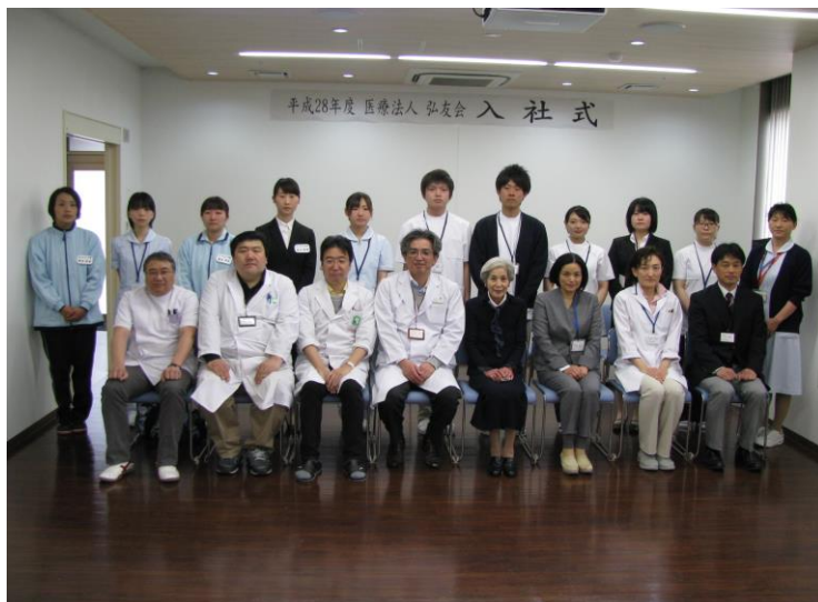
新入職員と役員等

平成28年4月1日より医療法人弘友会職員として、加戸病院や老人保健施設フレンドで勤務することになりました。新人研修で教わった弘友会の5つの理念を忘れず、精一杯頑張りたいと思います。どうぞよろしくお願いいたします。