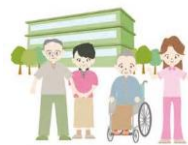
介護施設・高齢者住宅