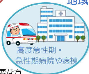
高度急性期・急性期病院や病棟