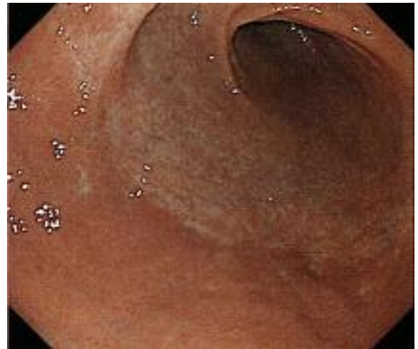
上の図は、萎縮性胃炎の内視鏡像。手前は萎縮のない正常粘膜（ピンク色）で、奥の白い部分は萎縮した粘膜です。

出てくる可能性が高いため、早期の胃癌を発見するために定期的な検査が勧められます。また、ピロリ菌に感染していることがわかった場合には、早めの除菌が望まれます。幸いなことに、萎縮性胃炎から発生する癌は胃癌のなかでは比較的悪性度が低い（高分化型の癌という）と言われていきます。もし胃癌が出来ても早期に見つければお腹を切らなくても胃カメラで完全に治療出来る可能性が高いため、なるべく早く発見して完治することが大切です。ご心配の方は、病院でご相談ください。胃癌の予防・早期発見に努めましょう。